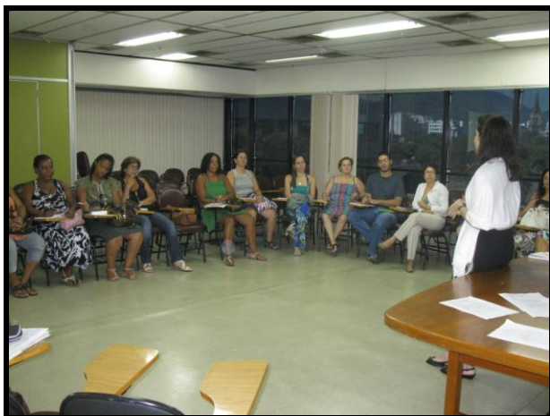
Alguns professores que participaram do grupo da manhã

Em fevereiro, nos dias 10 e 11, durante a Semana de Capacitação da Secretaria, dois grupos participaram do curso de introdução de habilidades de Resolução de Conflitos nas Escolas. Ao todo, 46 professores participaram das dinâmicas aplicadas pelos facilitadores da Parceiros Brasil, principalmente em técnicas de comunicação não-violenta (como escuta cooperativa, mensagem em primeira pessoa, percepção de sentimentos, etc).